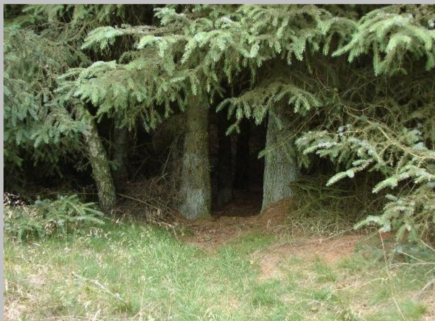
Forside billede: Porten i Skoven, GC13XAB